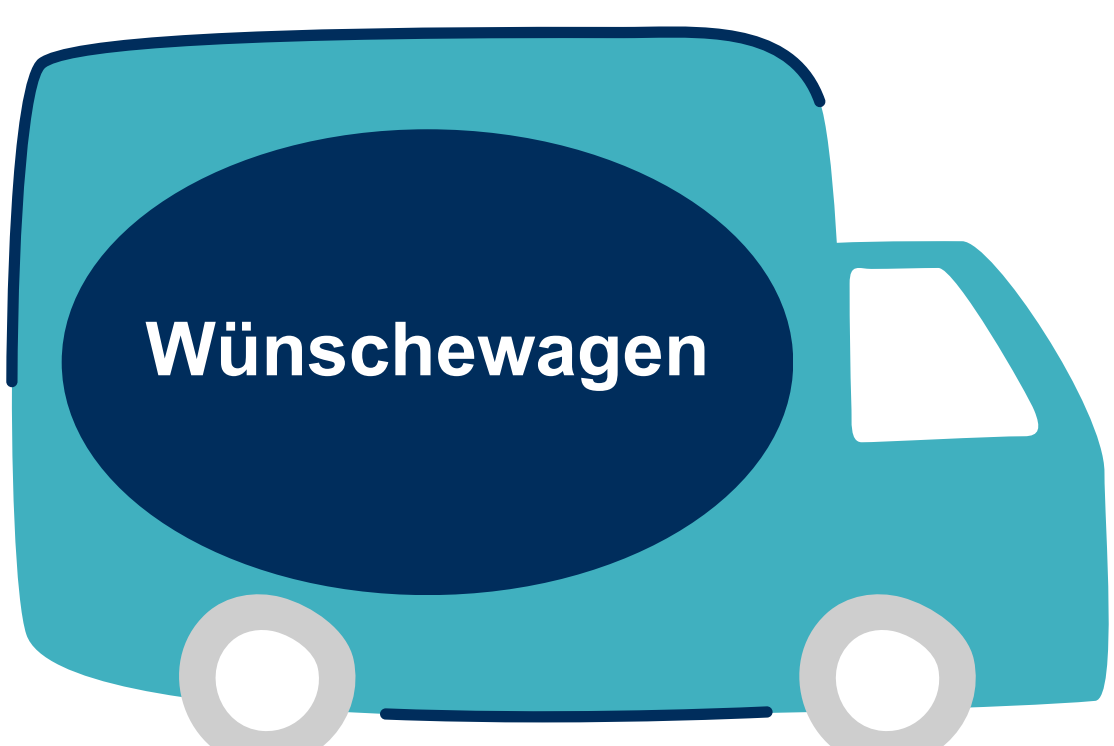
Abb. 9: Ambulance Transportation Free From Style Icon [16]

Die Patientin fühlt sich ganzheitlich versorgt. Dies ermöglicht ihr ihr soziales Umfeld und die gute Pflege. Sie ist mit ihrer Lebensqualität zufrieden, auch ohne Hoffnung auf Heilung.