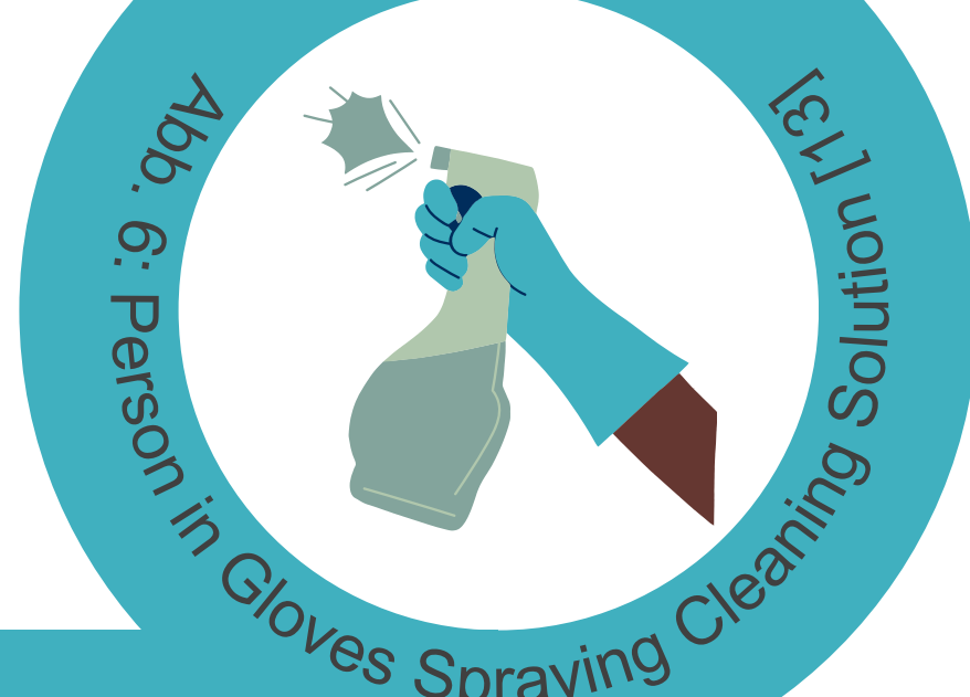
Abb. 6: Person in Gloves Spraying Cleaning Solution [13]