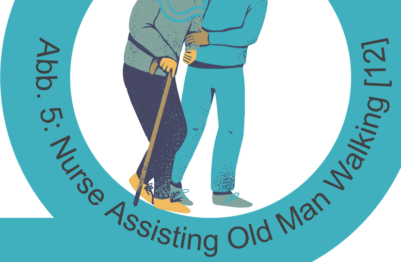
Abb. 5: Nurse Assisting Old Man Walking [12]