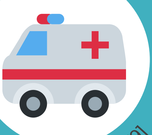
Abb. 2: ambulance [9]