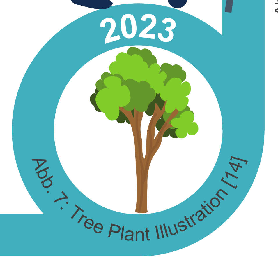
Abb. 7: Tree Plant Illustration [14]

Interview einer chronisch kranken Patientin.