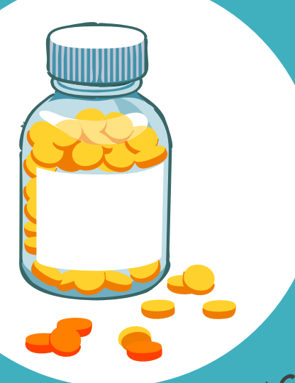
Abb. 3: Bottle of Tablets [10]