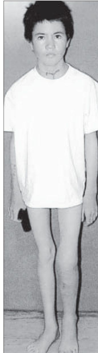
In Morads rechtem Bein wurde eine Knochenkrankheit behandelt.