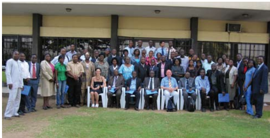
Die Teilnehmer des 2. DAAD Alumni-Meetings in Lagos

Das erste Alumnitreffen der nigerianischen DAAD-Alumni ist für das erste Quartal 2010 vorgesehen. Auch außerhalb der regelmäßigen Zusammenkünfte können