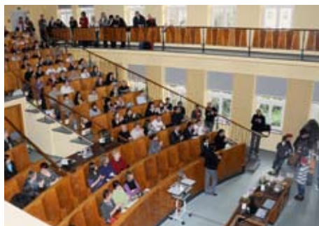
Teilnehmer des 6. Wundforums

Das 6. Wundforum der Klinik für Allgemein-, Viszeral- und Gefäßchirurgie fand am 9. Dezember 2009 statt. Nach einer kurzen Begrüßung durch die Organisatorin der Veranstaltung, Pflegedienstleiterin Dagmar Halangk, wartete eine Überraschung auf die 230 Teilnehmer.