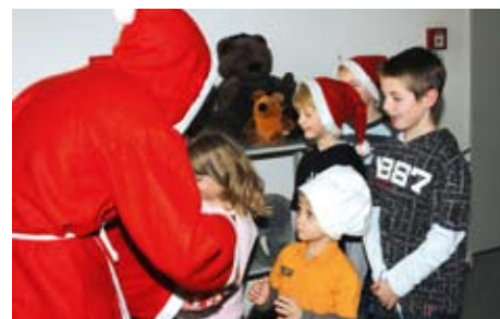
Besuch vom Nikolaus