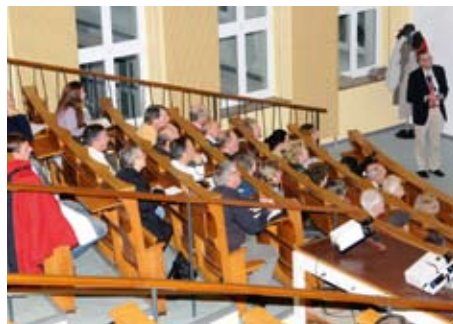
Grand Round am 11. November 2009

Epilepsie ist eine der häufigsten neurologischen Krankheitsbilder mit einer geschätzten Prävalenz zwischen 0,5 und 1,0 Prozent. Am 11. November 2009 fand eine Grand Round zum Thema Epilepsie statt; das Datum hatte einen aktuellen Anlass: bereits seit Mai dieses Jahres wird in der Universitätsklinik für Neurologie für Epilepsie-Patienten das sogenannte „Video-EEG-Monitoring“ durchgeführt. Seit Anfang November wird dieses aufwendige diagnostische Überwachungsverfahren durch einen nächtlichen Dienst von studentischen Hilfskräften erweitert. Im Video-EEG-Monitoring wird der Patient gleichzeitig mit einer digitalen Kamera und einer kontinuierlichen Hirnschriftableitung (EEG) über mehrere Tage hinweg