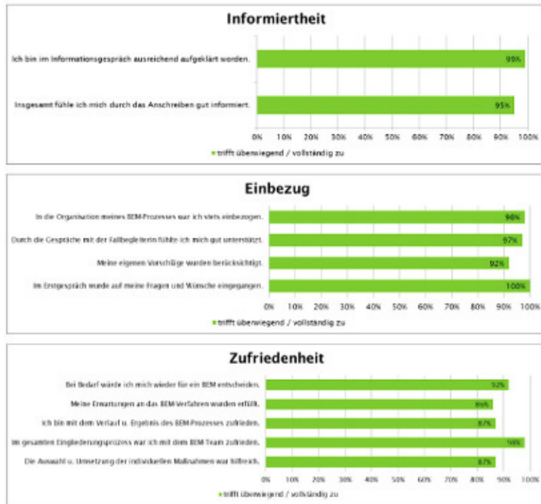
Auswertung Fragebögen BEM – Artikel BEM

Der Fragebogen beinhaltet zwölf Fragen zum BEM-Prozess die auf einer Fünf-Punkte-Skala mit Antwortmöglichkeiten von „trifft vollständig zu“ bis „trifft nicht zu“ beantwortet werden. Am Ende gibt es noch die Möglichkeit, im Rahmen einer offenen Frage konkrete Verbesserungsvorschläge oder Kritik anzugeben. Die betroffenen Beschäftigten werden danach gefragt, wie gut sie sich informiert und einbezogen fühlten. Weiterhin können Angaben dazu gemacht werden, ob sich die Wiedereingliederung auf den individuellen Gesundheitszustand ausgewirkt hat und wie zufrieden die Mitarbeiterinnen und Mitarbeiter mit dem BEM-Prozess sowie allen Beteiligten waren.