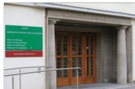
Das Zentrum für Pathologie und Rechtsmedizin der Universität in Magdeburg.

M agdeburg | Der Rechtsausschuss des Landtags befasst sich am morgigen Freitag mit der Situation der finanziell angeschlagenen Institute für Rechtsmedizin in Magdeburg und Halle. Diese schreiben nach Angaben der Staatskanzlei jährliche Verluste von insgesamt rund 900.000 Euro. Da die Rechtsmedizin somit quasi ein Notfall-Patient ist, wird bereits seit längerem über die Zukunft der Institute diskutiert. Dazu liegt jetzt ein Vorschlag der Landesregierung vor.