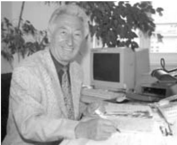
Dr. Wolfgang Ritter

Sollen sich Bewerber künftig weiterhin bei der ZVS um einen Studienplatz bewerben und parallel dazu direkt an ihren Wunschhochschulen? Wieviele Einrichtungen können maximal angeschrieben werden?